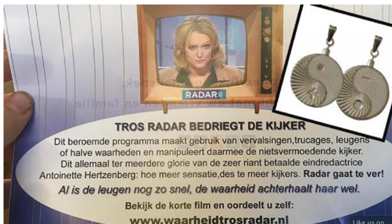
Flyer verspreid in Hilversum in 2016.

Op 26 september 2016 werd de BioStabil in een uitzending van Radar over elektromagnetische straling genoemd in een kort fragment. 126 Een maand later liet Santanera 1,5 miljoen flyers drukken (zie kader) en verspreiden in Hilversum. 127 Bij de Raad voor de Journalistiek werd ook een nieuwe klacht ingediend. Deze werd eveneens niet door de Raad behandeld omdat Radar niet meedeed aan de procedure van de Raad, en de klacht door de Raad niet van algemene strekking of principieel belang werd geacht. 128